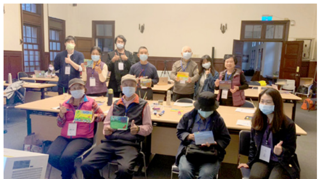
聽覺組成員與成博志工們大合影