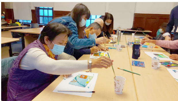
藝術療育課程進行中

在五感體驗活動中，志工長者們洋溢著幸福和喜悅。期許未來我仍有機會再參與類似的藝術活動，為深化博物館對樂齡長者的社會服務而努力，也為「藝術療育」盡棉薄之力。